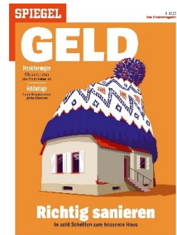
Cover: SPIEGEL GELD 3/2023

Darüber hinaus zeigt SPIEGEL GELD klare Handlungsoptionen auf und behandelt Anlagefragen weitgreifend und tiefgehend.