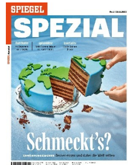
Cover: SPIEGEL SPEZIAL 2023

SPIEGEL SPEZIAL erscheint einmal jährlich. Das Thema wird jeweils im Laufe des ersten Halbjahres festgelegt.