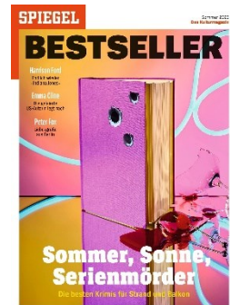
Cover: SPIEGEL BESTSELLER 2/2023

Zentraler Bestandteil des Hefts sind Bestsellerlisten aus Literatur, Film und Musik – unbestechlicher Indikator für die hohe Publikums- und Kaufrelevanz!