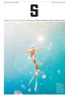
Cover: S-Magazin 1/2023

S-Magazin Leser:innen sind gebildet, einkommensstark und gehören zu den wichtigen Multiplikatoren der Gesellschaft.