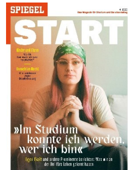
Cover: SPIEGEL START 4/2023

Neben dem Printheft bildet das SPIEGEL START Digitalangebot auf spiegel.de alle für die junge Zielgruppe relevanten Themen auch digital ab.