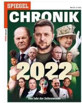
Cover: SPIEGEL CHRONIK 2022

Die SPIEGEL CHRONIK wird sowohl an Abonnent:innen versandt als auch im Handel verkauft; dort beträgt die Auslagezeit vier bis sechs Wochen.