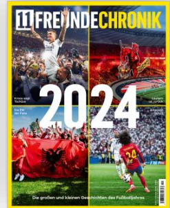
Cover: 11FREUNDECHRONIK 1/2024

11FREUNDECHRONIK lässt die schönsten und erinnerungswürdigsten Momente des zurückliegenden Fußballjahres in opulenten Bildern Revue passieren und ist ein echter Hingucker auf der vorweihnachtlich gedeckten Kaffeetafel!