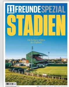
Cover: 11FREUNDESPEZIAL 2/2025

11FREUNDESPEZIAL erscheint zweimal im Jahr und behandelt immer ein anderes Thema aus der Welt des Fußballs. So standen bisher zum Beispiel die unterschiedlichen Fußballdekaden, die Geschichte der Fans oder das Fußballmutterland England im Fokus.