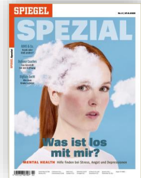
Cover: SPIEGEL SPEZIAL 2/2025

Dabei kann es um das Ergebnis einer Bundestagswahl gehen oder einem wissenschaftlichen Themenkomplex. Erschienen sind darüber hinaus auch bereits Auseinandersetzungen mit der Spannung zwischen den Generationen oder Ernährung vor dem Hintergrund der klimatischen Veränderungen.