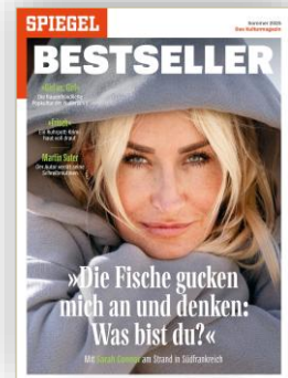
Cover: SPIEGEL BESTSELLER 2/2025

Zentraler Bestandteil des Hefts sind Bestsellerlisten aus Literatur, Film und Musik – unbestechliche Indikatoren für die hohe Publikums- und Kaufrelevanz!