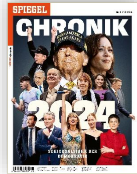
Cover: SPIEGEL CHRONIK 2024

Die SPIEGEL CHRONIK wird sowohl an SPIEGEL -Abonent:innen versandt als auch im Handel verkauft; dort beträgt die Auslagezeit vier bis sechs Wochen.