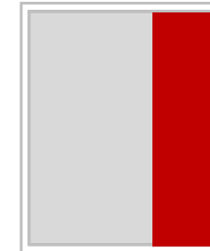
1/3 Seite hoch