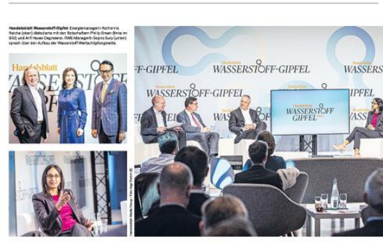
Handelsblatt Wasserstoff-Gipfel Energieexperten in Karlsruhe diskutieren vor dem Wasserstoff-Netzplan...